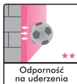
Odporność na uderzenia