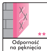
Odporność na pęknięcia