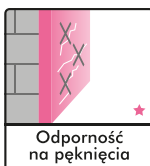
Odporność na pęknięcia